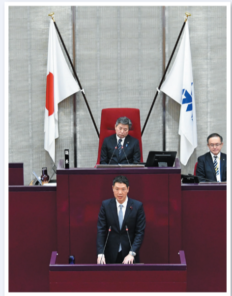
▲令和8年3月議会質問の様子