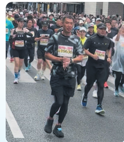
福岡マラソン2025に初挑戦、無事に完走しました。