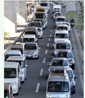
▲野多目交差点付近渋滞時

福岡外環状道路が全線開通してから10年以上が経過しましたが、ガンセンター入口交差点では慢性的な渋滞が続いています。特に朝夕の通勤時間帯には約1kmの渋滞が発生し、地域の皆さまの生活にも影響が出ています。 また、この交差点では事故も多く、人身事故が年間72件発生しており、平均すると約5日に1回の頻度となっています。渋滞だけでなく交通安全の面からも、地域の皆さまから不安の声が寄せられてきました。 私はこれまで議会でのこの問題を取り上げ、事故防止と渋滞解消のため、交差点の抜本的な改善を求めてきました。 その結果、このたび福岡市の道路整備計画である「福岡市道路整備アクションプラン2028」に当該交差点の対策が位置付けられました。今後は交差点改良の設計を進め、着工に向けて具体的な検討が進められる予定です。 引き続き、地域の皆さまの声を市政に届けながら、渋滞の解消と交通安全の確保に取り組んでまいります。