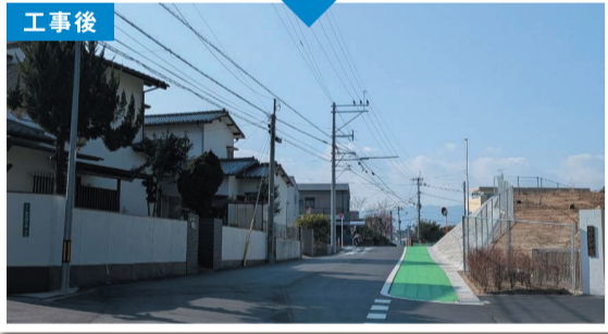
工事前:老司4丁目地内市道の拡幅 工事後 道幅が狭く、通学する子供達と車との接触の危険があったが道幅も広がり、グリーンベルトも設置し子供達の安全を確保