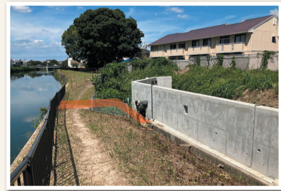
那珂川の氾濫対策 水路へのフラップゲート設置予定箇所(R8年8月完成予定)