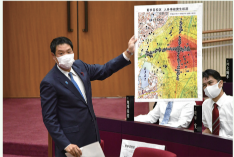
▲野多目の渋滞について議場にて現状を説明