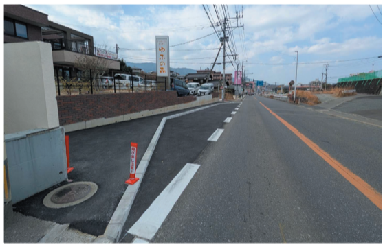
やよい坂の渋滞解消に向けバスケットを設置(R8年2月~共用開始)